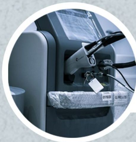
لیزر جنتل پرو کندلا 2020