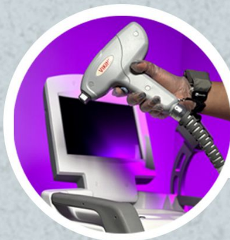
لیزر دایو ویکینی 2022